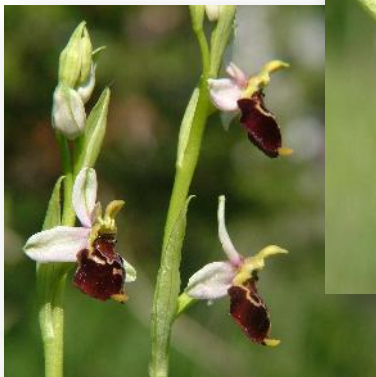
Ophrys fuciflora Hummelragwurz - weiß oder rosa blühende Naturform, schön gezeichnete, samtige Lippe