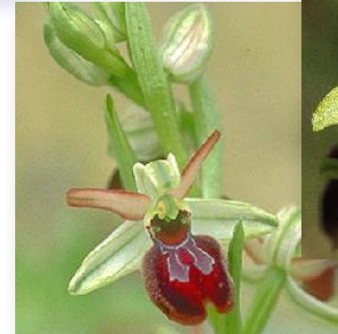
Ophrys sphegodes Große Spinnenragwurz - interessante Naturform mit schöner Zeichnung