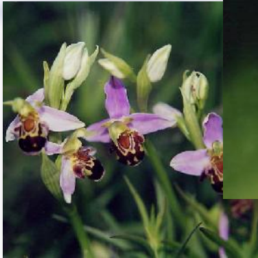
Ophrys apifera Bienenragwurz - Naturform mit intensiv gefärbten Blüten und samtiger Lippe